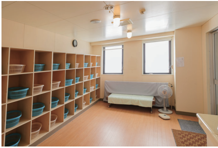
スポーツ施設や浴場の脱衣所の給水サービス