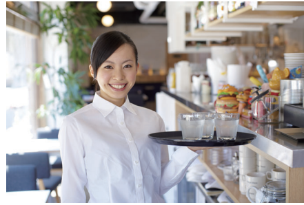
飲食店や食堂でおいしいお水のご提供