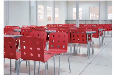
工場や事務所の休憩室で熱中症対策